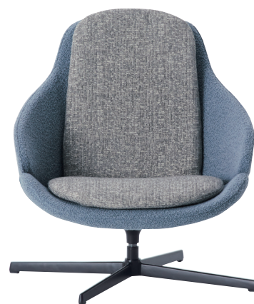
01 : FG-2000 / FG-2407