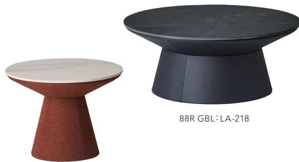
58R GWH: FG-2404