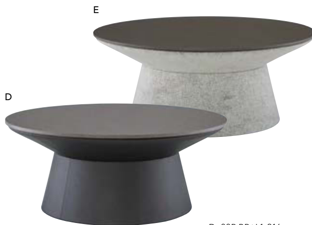
D. 88R BR: L1-216 E. 88R GY: 48-6009