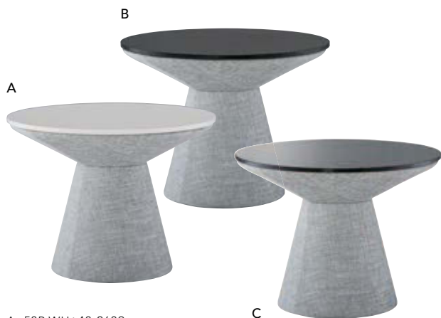
A. 58R WH: 48-2609 B. 58R BL: 48-2609 C. 58R SG: 48-2609