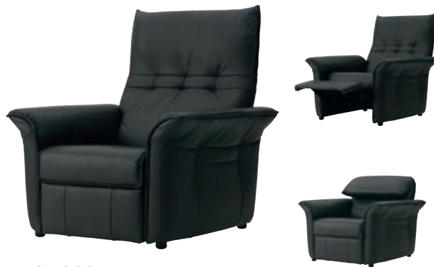
01 : L3-513